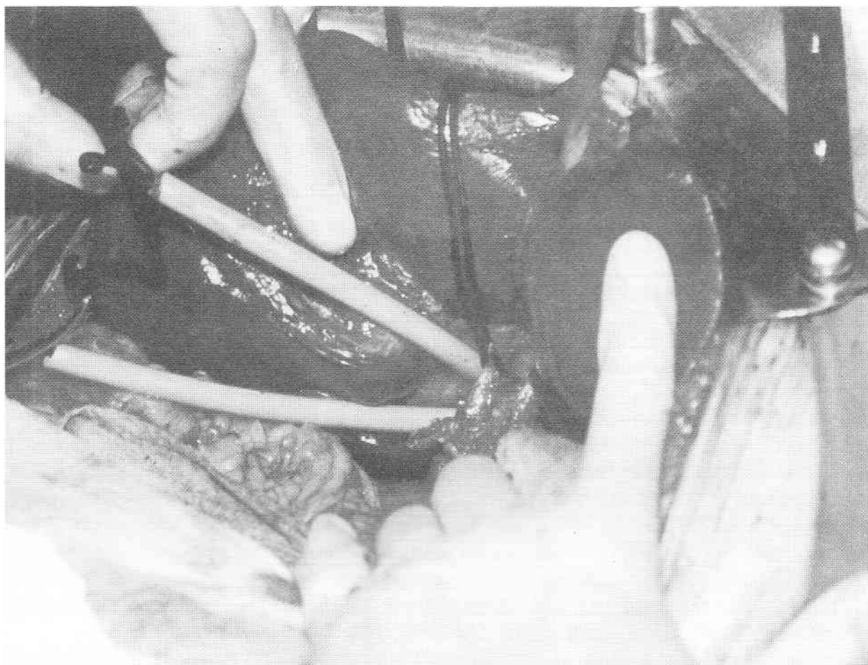
Fig. 1: Maniobra de Pringles: Se muestra la glándula hepática por su cara inferior. Realizada la colecistectomía, se identifica la arteria hepática y la vena porta cargadas y jalonadas.