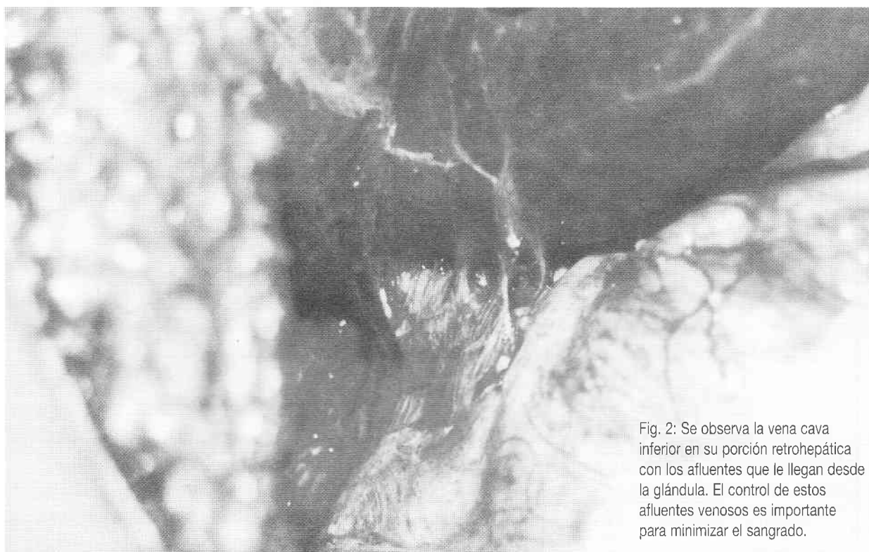
Fig. 2: Se observa la vena cava inferior en su porción retrohepática con los afluentes que le llegan desde la glándula. El control de estos afluentes venosos es importante para minimizar el sangrado.