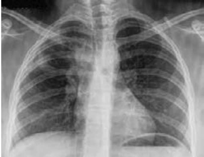
Figura 1: Imagen con lesión infiltrativa en lóbulo superior derecho y ensanchamiento mediastinal, por posibles adenopatías.

vena subclavia hacia los territorios distales de la mano, sin evidencia de trombosis ni tromboflebitis. En radiografía de tórax (Fig. 2) aparece gran masa en lóbulo superior derecho en íntimo contacto con el mediastino y ensanchamiento del mismo, sin presencia de broncograma aéreo.