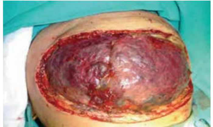
Figura 2: Extracción del silo, exploración del hígado posterior a la resección y preparación para el cierre abdominal.

En el neuroblastoma, la edad es un factor pronóstico y se considera que ser menor de un año es favorable. Sin embargo,