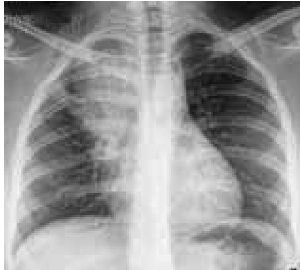
Imagen paramediastina infiltrativa, atelectasia de lóbulo superior derecho y ensanchamiento mediastinal.

PUBLICACIÓN DEL HOSPITAL PRIVADO UNIVERSITARIO DE CÓRDOBA S.A.