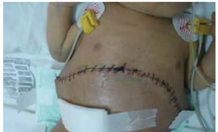
Figura 3: Cierre de pared abdominal con escasa tensión.

en la etapa neonatal las metástasis hepáticas suelen infiltrar el órgano en forma difusa generando un crecimiento inusual del hígado que conduce a una situación crítica que amenaza la vida del paciente, al provocar un fallo multiorgánico por la excesiva presión intraabdominal. En esta situación se deben tomar medidas de salvataje que no están exentas de riesgos colaterales.